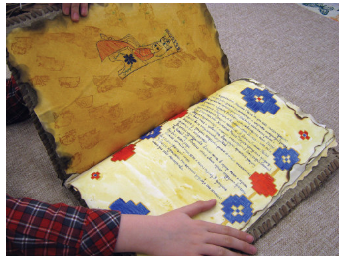
Результат проекта — рукотворная книга «Легенды Страны Кожаная Магия»