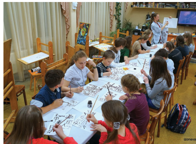
Мастер-класс по каллиграфии для участников проекта