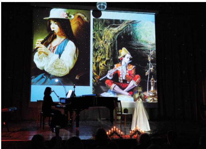
Участники проекта на сцене Дворца