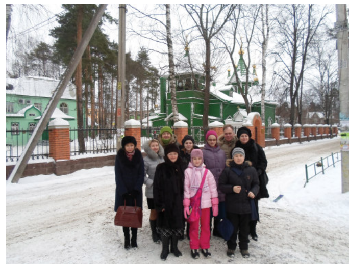
Участники проекта у Свято-Троицкого храма