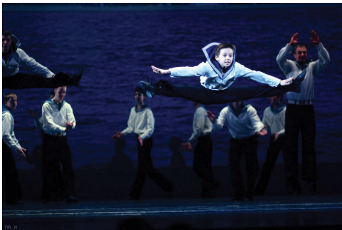
«Матросский танец» в исполнении ансамбля «Юный ленинградец»