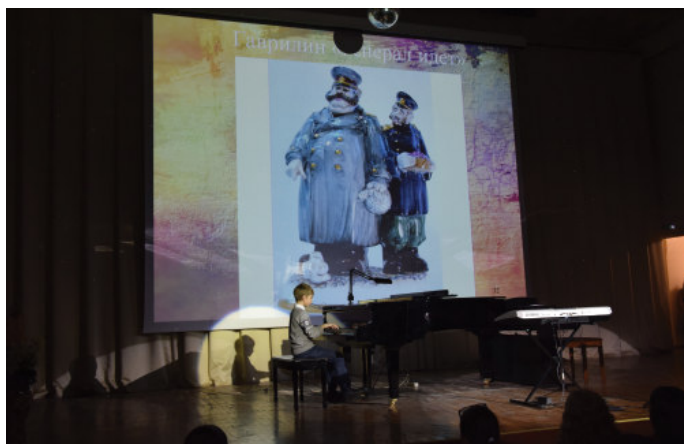
Фрагмент музыкальной гостиной

веты дела, методические объединения, родительские комитеты, советы старшеклассников и т. д., которые осуществляют непосредственное взаимодействие с организациями партнёрами по реализации конкретной инициативы.