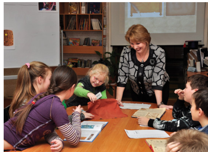
Библиотечное занятие участников проекта