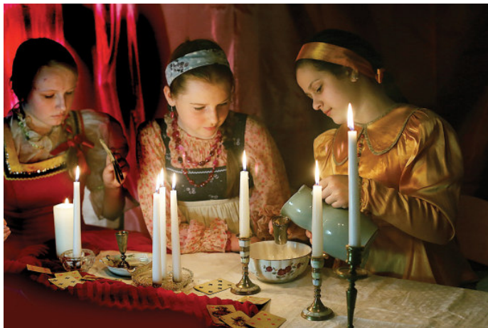
Фотосессия «Святка» участников проекта