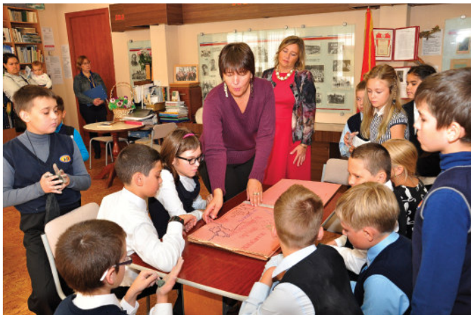
Команда участников проекта в музее «История детского движения Красногвардейского района» (ДДЮТ «На Ленской»

4. Промежуточные выставки детских творческих работ по каждому элементу проекта.