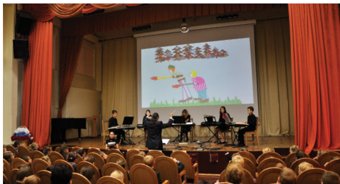
Участники проекта исполняют симфоническую сказку С. Прокофьева