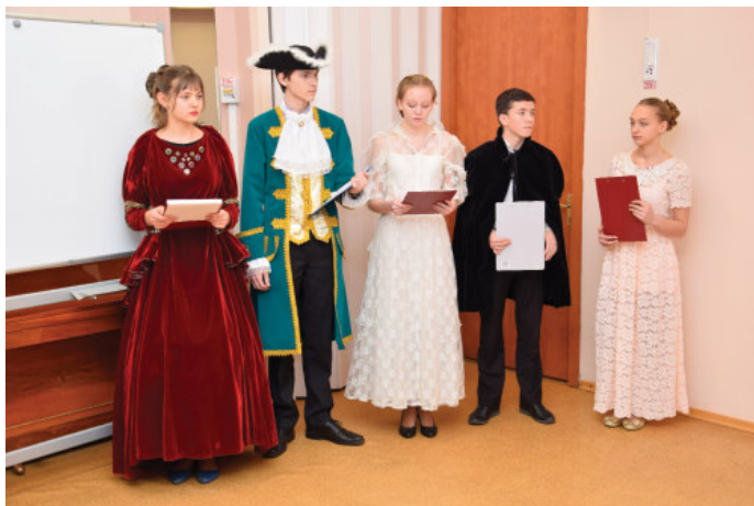
Фото участников проекта