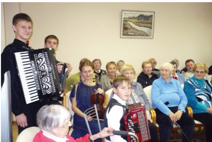
Концерт участников проекта в КЦСОН