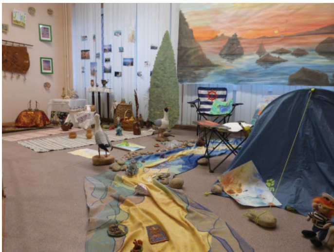
Тематическая выставка участников проекта «Я отдыхал в Крыму»