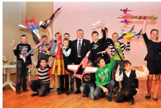
Встреча участников проекта с летчиком-космонавтом РФ, Героем России А. И. Борисенко